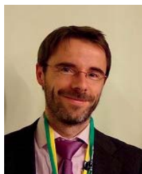
NICOLAII Béatrice Pharma